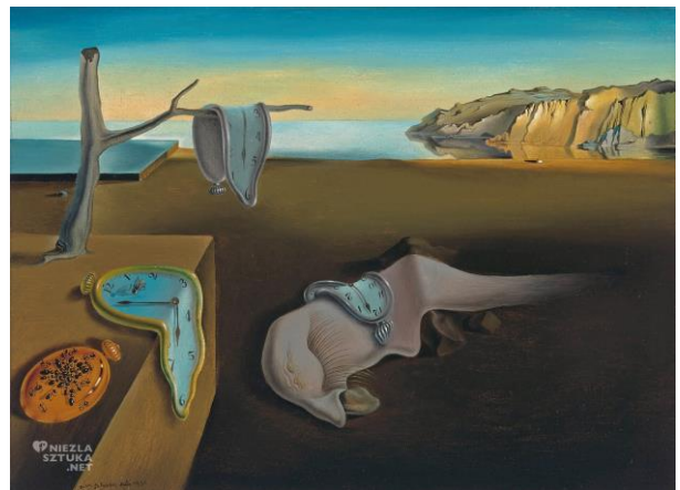
The Persistence of Memory - Salvador Dalí

3) ¿Qué época representa el siguiente cuadro? ¿Es Surrealismo?